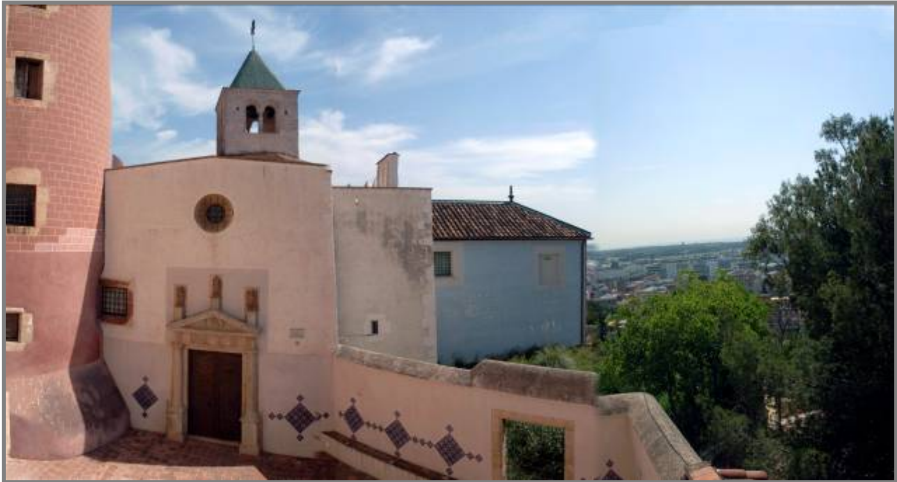
Patio de acceso a la Iglesia del Castillo